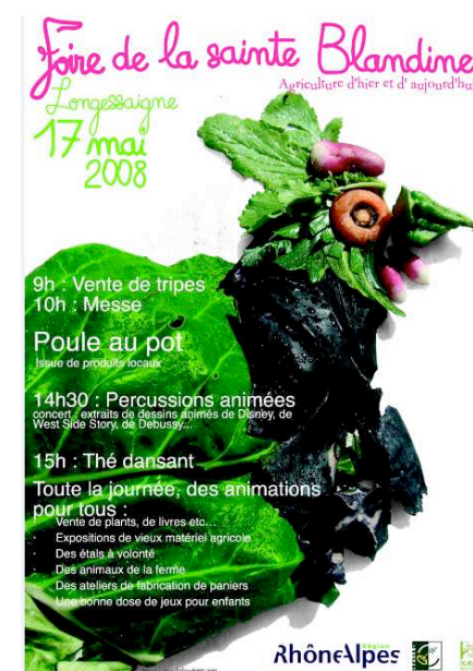
Graphisme affiche : J.S. PONCET, www.helioterre.com/

A noter dans vos Agendas : la Fête du Pays de Coise le 13 juillet 2008.